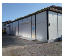
(写真左) 新倉庫の全景です。(写真中) 倉庫の場所がわかる