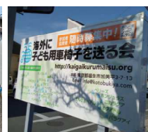
看板を設置しました。