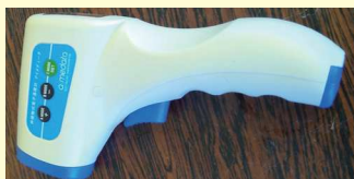
一瞬で体温想定が可能な温度計