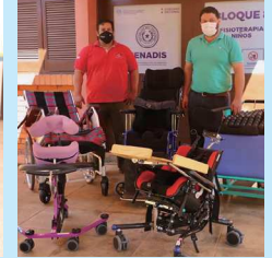
(写真左) パラグアイ向け車椅子の整備活動にパラグアイ駐日大使が見学、激励、お礼に来ていただきました。