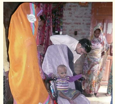
インド北部の貧しい農村地帯でこれまで車椅子を使ったことがなかったので、嬉しそうにはしゃぐ子ども達と喜ぶ家族の人たち