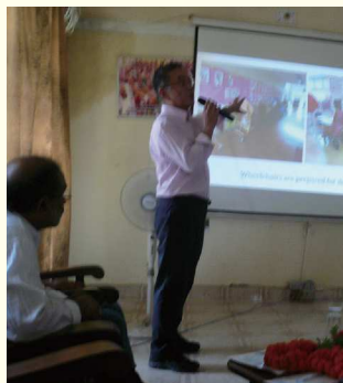
当会から日本で車椅子の提供や整備活動などに参加し支援してくれているボランティアの活動