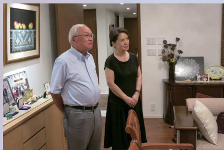
公邸でのトヨタシ・ナオユキ大使と令夫人