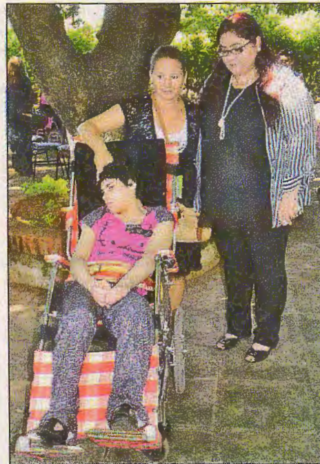
La ministra de Senadis, Rocío Florentín, al entregar su silla de ruedas a una de las beneficiarias. El aporte fue realizado por el Rotary Club del Japón.

de tareas emprendidas por la institución, con el lema: "Paraguay Vive la Inclusión".