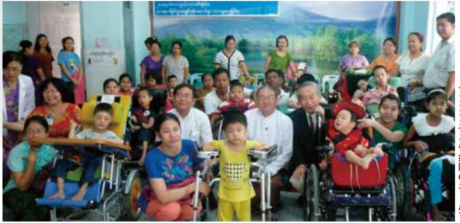
ヤンゴン子ども病院のホールで

ミャンマーの国立リハビリテーション病院とヤンゴン子ども病院に各45台を届け、それぞれの病院に通う子どもたちに貸与しました。ミャンマーには障がい児用の車椅子が入手できないので、病院としても治療のために有効に活用をしていくとのことでした。贈呈式では日本での特別支援学校のお母さんからの提供やボランティアによる整備活動を説明したら、出席者から感謝の大きな拍手をいただきました。