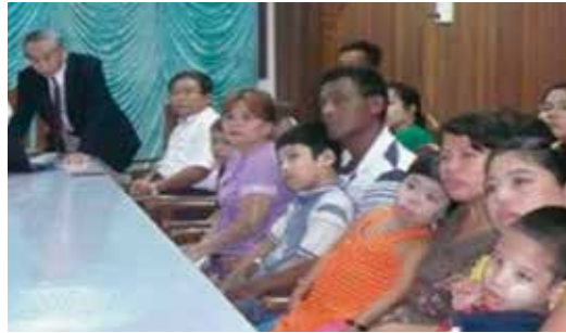
日本での当会活動紹介