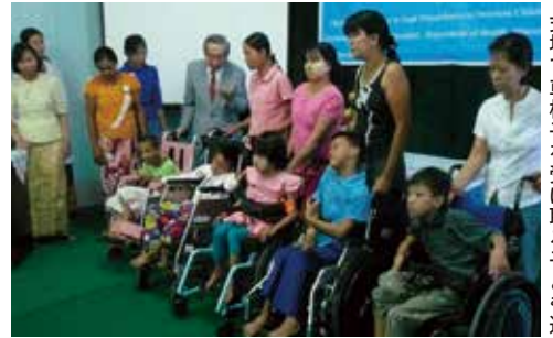
式場で車椅子を受け取る子ども達