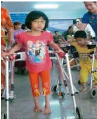
ウォーカーも貴重な器具