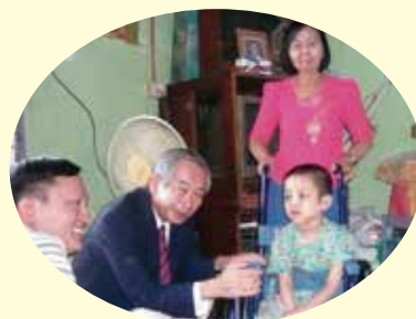
メンテックパイ君 6歳

2012年11月に車椅子を届けた家庭を訪問しました。ミャンマー人はきれい好きでどこでも車椅子はピカピカ磨かれているのに驚きました。